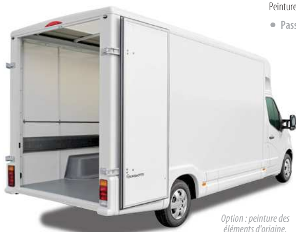
Option : peinture des éléments d'origine.